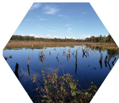
Marsch, Moor und Feuchtwiesen