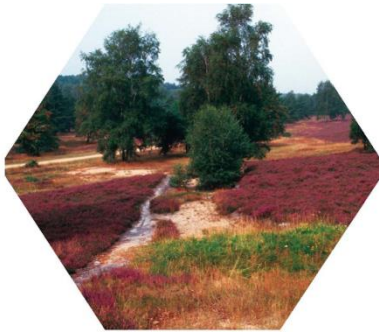
Heide und Trockenrasen