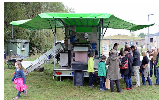
Am 05.11. können Sie ihr eigenes Obst zum Mosten mitbringen – zur umgehenden Verarbeitung an Kubinas Saftmobil

Gut Karlshöhe Hamburger Umweltzentrum Karlshöhe 60 d, 22175 Hamburg www.gut-karlshoehe.de