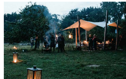
Waldfondue auf Gut Karlshöhe – ein kulinarisches Erlebnis am 06.11.

Gut Karlshöhe Hamburger Umweltzentrum Karlshöhe 60 d, 22175 Hamburg www.gut-karlshoehe.de