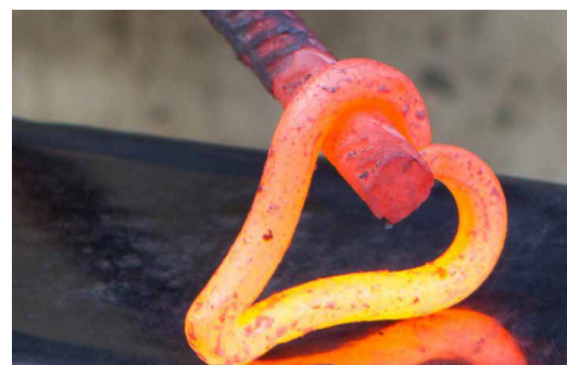
Einmal selbst den Schmiedehammer schwingen – kann man am 27.11. beim Schnupperschmieden.