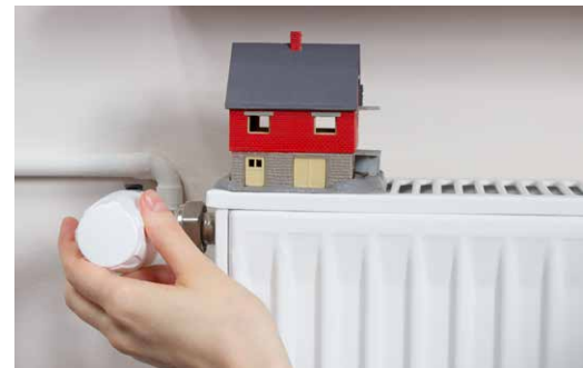
Energieberatung am 04.11. – mit Expert*innen der Verbraucherzentrale Hamburg

Leitung: Ulrich Kubina (Saftmobil); Kosten: Je nach Menge kostet die 5 l Bag-in-Box zwischen 4,50 und 6 Euro; Keine Anmeldung notwendig: https://bit.ly/3oeNxLx