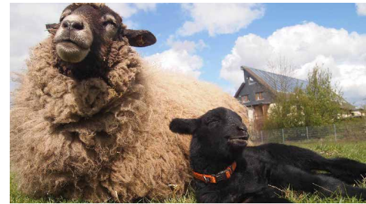
Inklusives Erlebnis am 22.4.: Schafe ganz nah auf der Weide erleben

Leitung: Theresa Hartwig; Kosten: 7 Euro; Für Erwachsene und Jugendliche mit und ohne Behinderungen; Anmeldung erforderlich: https://bit.ly/3oMcA86