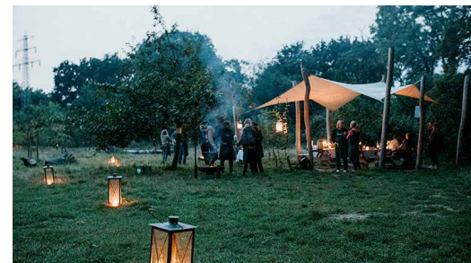
Waldfondue auf Gut Karlshöhe – ein kulinarisches Erlebnis am 9.4. und am 29.4.

Gut Karlshöhe Hamburger Umweltzentrum Karlshöhe 60 d, 22175 Hamburg www.gut-karlshoehe.de