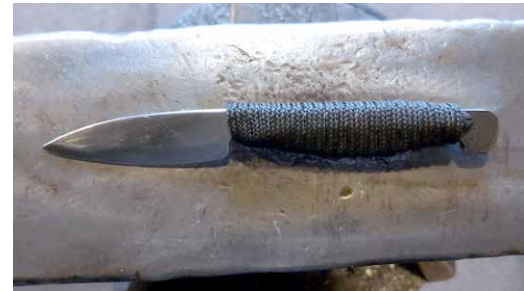
Vom Roheisen zum selbstgeschmiedeten Messer – am 9.4. beim „Abenteuer Messer Schmieden“

Leitung: Karl-Gerhard Seitz; Kosten: 338 Euro; Für Jugendliche und Erwachsene ab 16 Jahren; Anmeldung erforderlich: https://bit.ly/3GHE05v