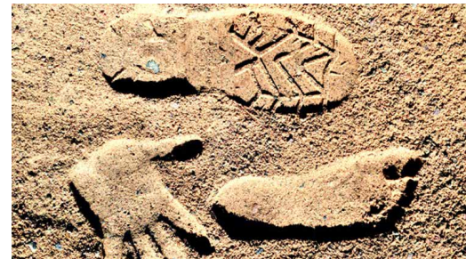
28.4.: Lehrkräftefortbildung „Projektwoche Ökologischer Fußabdruck“