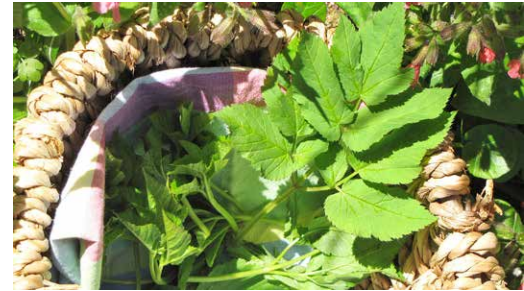
Wilde Kräuter entdecken und kreativ verarbeiten – am 22.4. und 23.4. auf Gut Karlshöhe