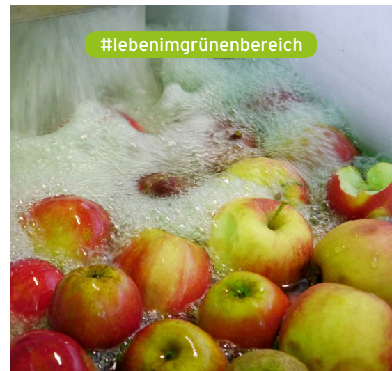
Kubinas Saftmobil - Hamburgs Mosterei auf Rädern

Leitung: Ulrike Dörr; Kosten: 120 Euro; Für Kinder zwischen 6 und 10 Jahren; Anmeldung erforderlich: https://bit.ly/3KAYyjC