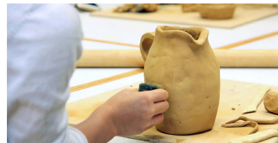
Ferienkurs Töpfern für Kinder (3 Tage)

Alle Angaben ohne Gewähr, Änderungen vorbehalten