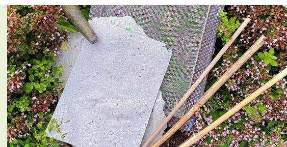
Ferienprogramm: Lesezeichen selbst geschöpft