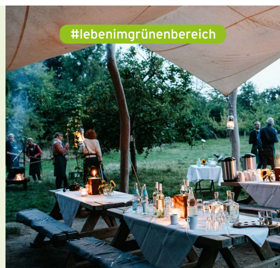
Waldfondue auf Gut Karlshöhe – ein kulinarisches Erlebnis

Alle Angaben ohne Gewähr, Änderungen vorbehalten