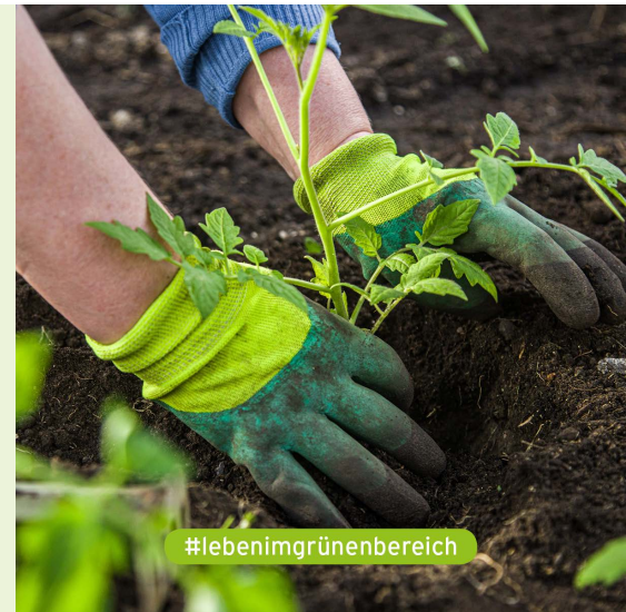
Einmal wöchentlich wird im „Mitmachgarten“ gemeinsam nach Permakultur-Prinzipien gegärtnert

Leitung: Almut Siewert; Kosten: keine; Anmeldung erforderlich: https://bit.ly/3NsVB8m (02.06.), https://bit.ly/42f1CcW (09.06.), https://bit.ly/429MHk3 (16.06.), https://bit.ly/3VAMzrX (23.06.) und https://bit.ly/41Tky0P (30.06.)