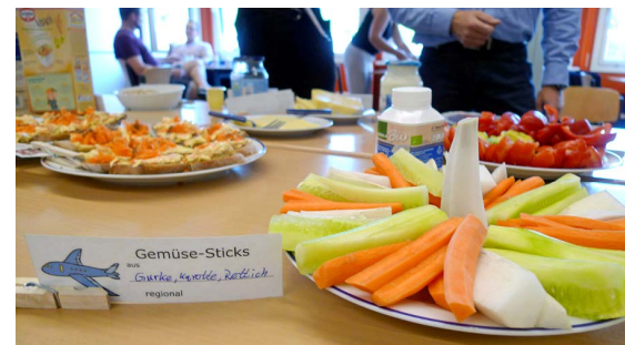
Das Klimafrühstück - Lehrkräftefortbildung am 07.06.

Frühstücken und Klima schützen? Was hat das miteinander zu tun? Die Fortbildung zeigt Wege auf, um Schülerinnen und Schülern diesen Zusammenhang näher zu bringen und verständlich zu machen. Das gemeinsame Frühstück bildet dabei den Kern.