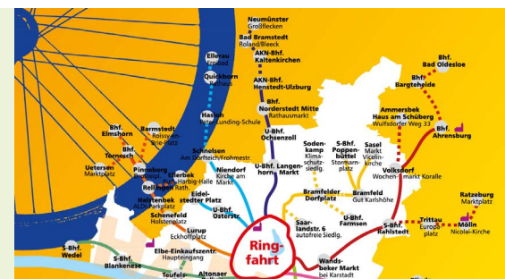
Fahrrad-Sternfahrt am 18.06.: Die genaue Route wird noch bekannt gegeben

Alle Angaben ohne Gewähr, Änderungen vorbehalten