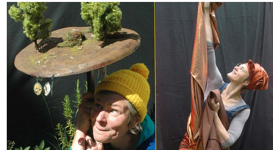
Die Vielfalt und die Bedeutung von Bodenlebewesen für den Humusaufbau – zeigt das Theaterstück „Das große Gewusel“ am 07.06.

Leitung: Sonja Ewald (Theater Mimekry); Für Kinder ab 3 Jahren; Kosten: 5 Euro; Anmeldung erforderlich: https://bit.ly/3VbGD8o