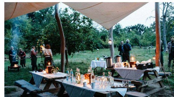
Waldfondue - ein kulinarisches Erlebnis in der Natur auf Gut Karlshöhe

Kosten: keine; Keine Anmeldung notwendig: https://bit.ly/466LtbR