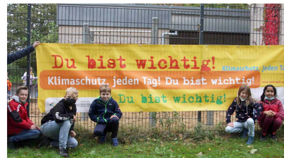
Klima - Ideen - Nachhaltig entwickeln können Mitarbeitende im Bildungsbereich am 09.11.