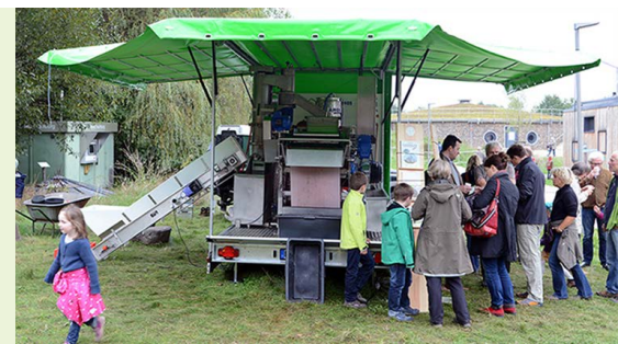
Kubinas Saftmobil: Hamburgs Mosterei auf Rädern macht am 03.11. Station auf Gut Karlshöhe

Leitung: SaftMobile W. Blume; Kosten: Je nach Menge kostet die 5 Liter Bag-in-Box zwischen 5,50 und 7 Euro; Keine Anmeldung notwendig: https://bit.ly/3Pm5ntl