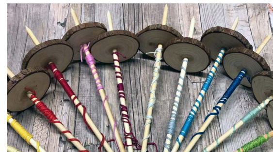
„Die spinnen auf Gut Karlshöhe“ - in der Lehrkräfteausbildung am 04.11.

Für Lehrkräfte aller Schulformen; Leitung: Stephanie Lotzin; Kosten: keine; Anmeldung erforderlich: https://bit.ly/3ZD3ThZ