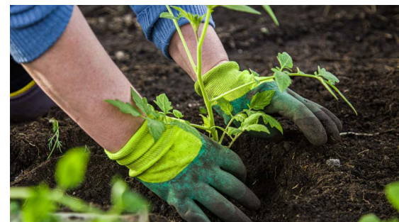
Einmal wöchentlich wird im „Mitmachgarten“ gemeinsam nach Permakultur-Prinzipien gegärtnert

Leitung: Almut Siewert; Kosten: keine; Anmeldung erforderlich: https://gut-karlshoehe.de/veranstaltungstermine/