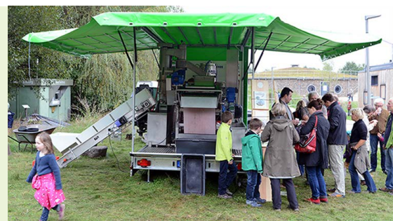
Kubinas Saftmobil: Hamburgs Mosterei auf Rädern macht am 20.10. und 03.11. Station auf Gut Karlshöhe

Leitung: SaftMobile W. Blume; Kosten: Je nach Menge kostet die 5 Liter Bag-in-Box zwischen 5,50 und 7 Euro; Keine Anmeldung notwendig: https://bit.ly/3EnF0Nd und https://bit.ly/3Pm5ntI