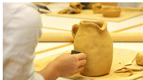
Aufbaukeramik mit Phantasie: Ferienkurs Töpfern ab dem 23.10.