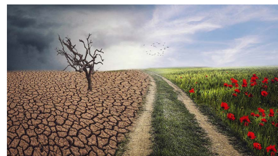
Im Rollenspiel die Bundesrepublik aus der Klimakatastrophe herausführen - beim Escape Game Climate am 08.10.

Am 14.09. ist es soweit - dann startet der neue Wochenmarkt auf Gut Karlshöhe. Immer donnerstags von 14 bis 18 Uhr gibt es eine große Auswahl frischer Produkte von Hamburger Erzeugern und Landwirten aus der Region. Kommt vorbei!