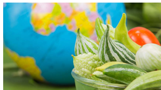
Planetary Health Diet: Workshop für Ernährungsfachkräfte am 03.11. und 04.11.

Alle Angaben ohne Gewähr, Änderungen vorbehalten