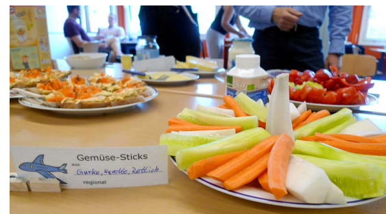
Das Klimafrühstück - Lehrkräftefortbildung am 07.06.

Frühstücken und Klima schützen? Was hat das miteinander zu tun? Die Fortbildung zeigt Wege auf, um Schülerinnen und Schülern diesen Zusammenhang näher zu bringen und verständlich zu machen. Das gemeinsame Frühstück bildet dabei den Kern. So